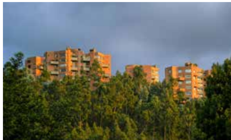
▲▼ Fotografía: José Roberto Arango

Decreto 1715 de 1978 artículos 2.º, 3.º y 4.º