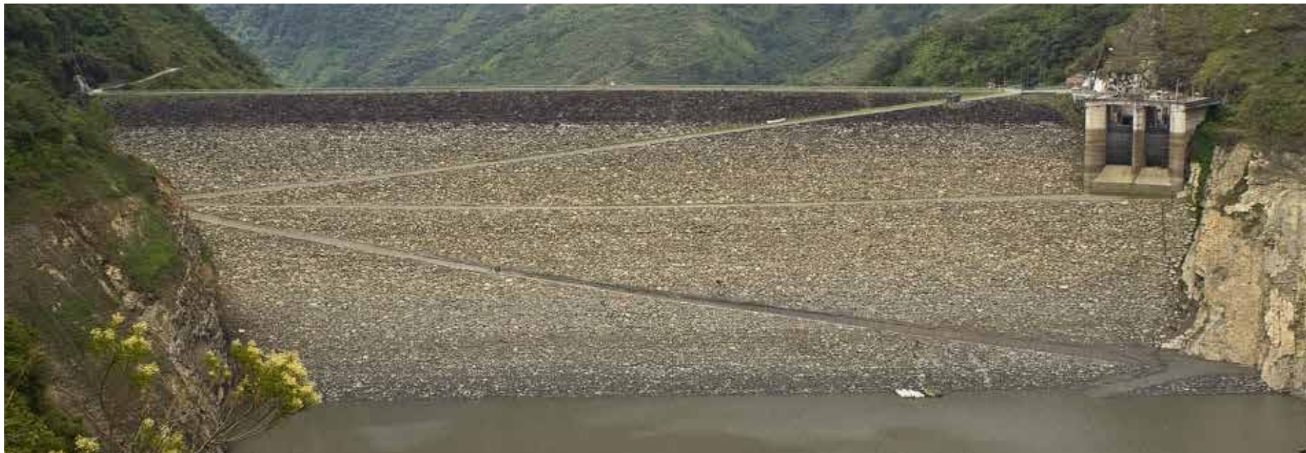
▲ Fotografía: José Roberto Arango