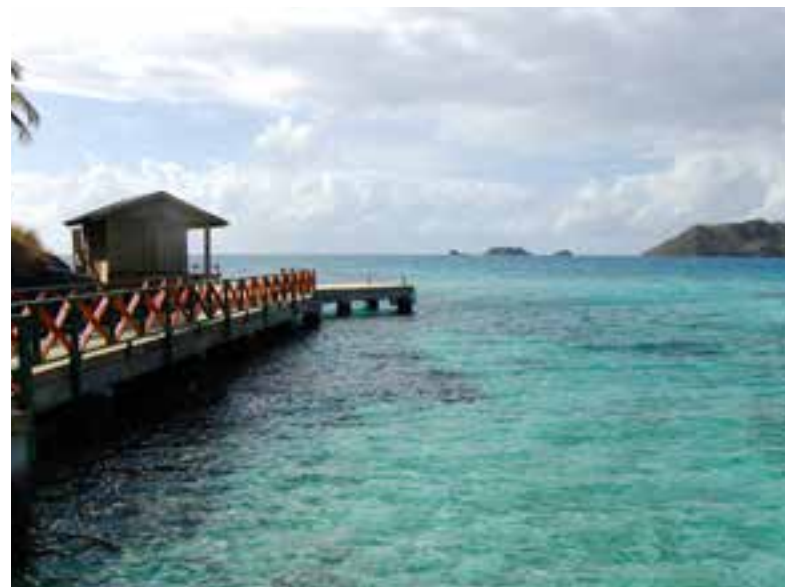
▲ Fotografía: Melissa Valenzuela

Corte Constitucional. Sentencia C-760 de 2007. Expediente No. T-1398036 Magistrada ponente Dra. Clara Inés Vargas Hernández. Bogotá D.C., 25 de septiembre de 2007.