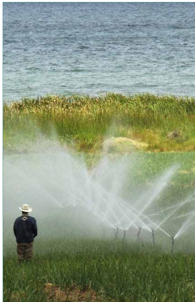
▲ Fotografía: José Roberto Arango

Decreto 1541 de 1978 artículos 238 y 239